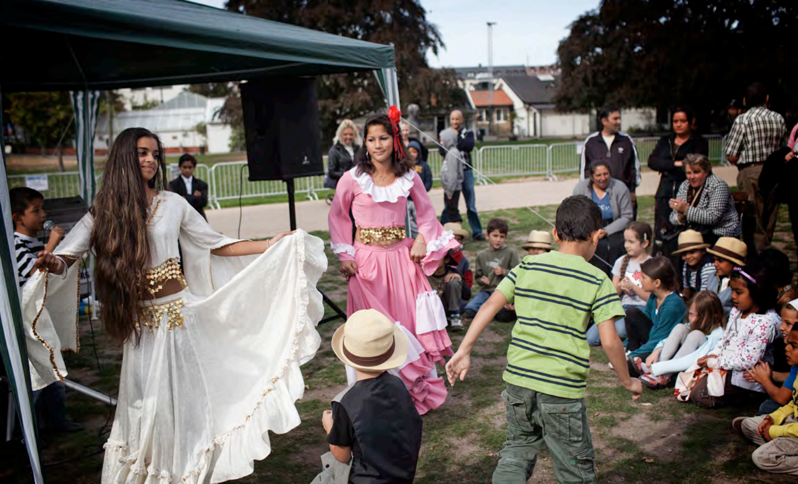
I Malmö Folkets park firas romsk kulturvecka med dans, sång och matlagning.

Romernas nationaldag firas den 8 april varje år. Man har en romsk flagga och det finns en nationalhymn som heter Gelem, Gelem (Jag har vandrat). På nationaldagen sjunger man nationalhymnen och hissar den romska flaggan.