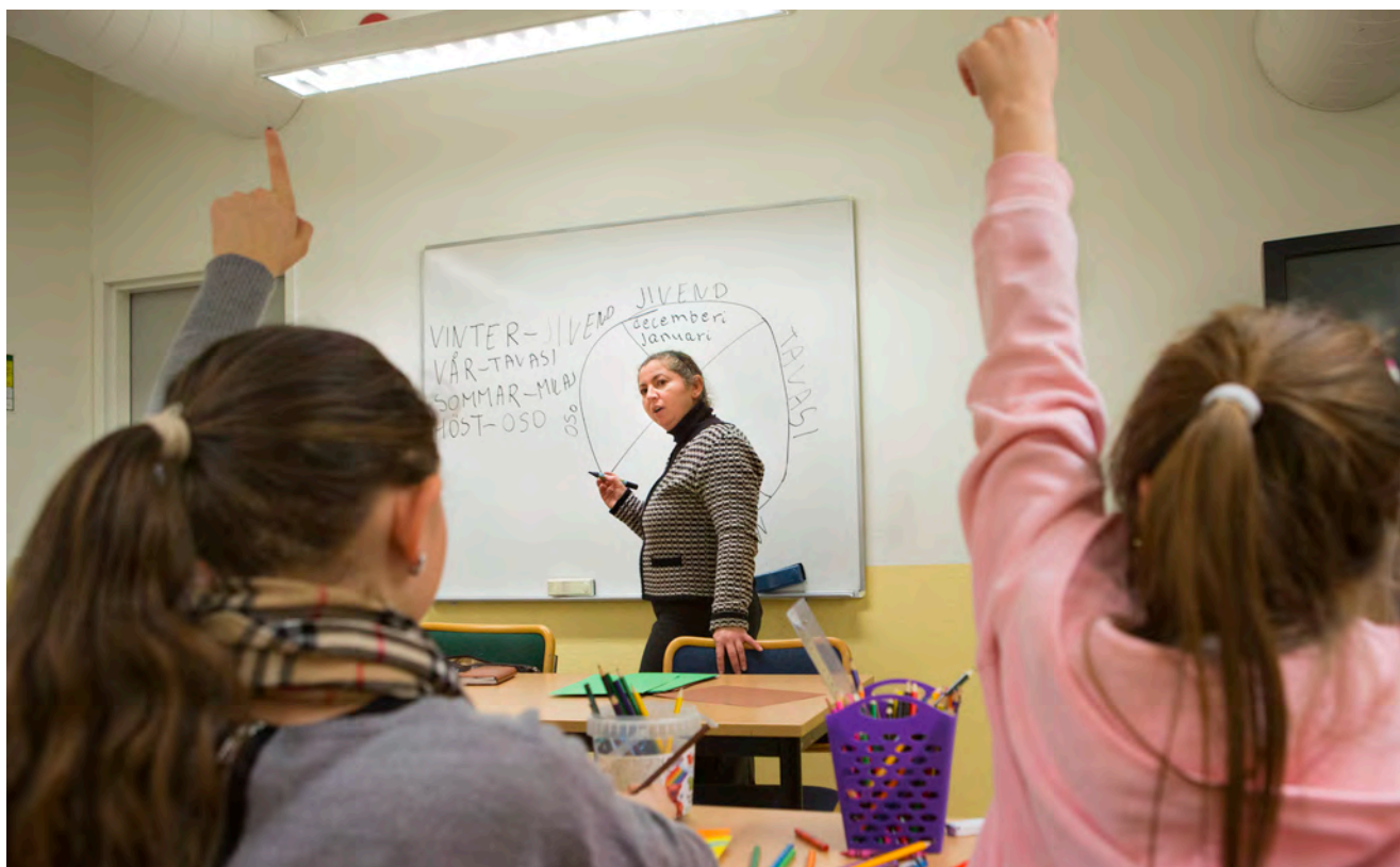
Modersmålsundervisning i romska pågår.

I skolan kan man få läsa romska som modersmål och man behöver inte kunna någon romska eller ha pratat romska hemma för att få modersmålsundervisning om man tillhör den nationella minoriteten romer. De nationella minoriteterna har också lite större rätt till modersmålsundervisning: om en elev i klassen vill ha undervisning, så ska skolan arrangera det. För övriga minoritetsspråk krävs att fem elever vill ha undervisning. Ett problem för alla minoritetsspråk är emellertid att det finns så få lärare som kan undervisa i dem.