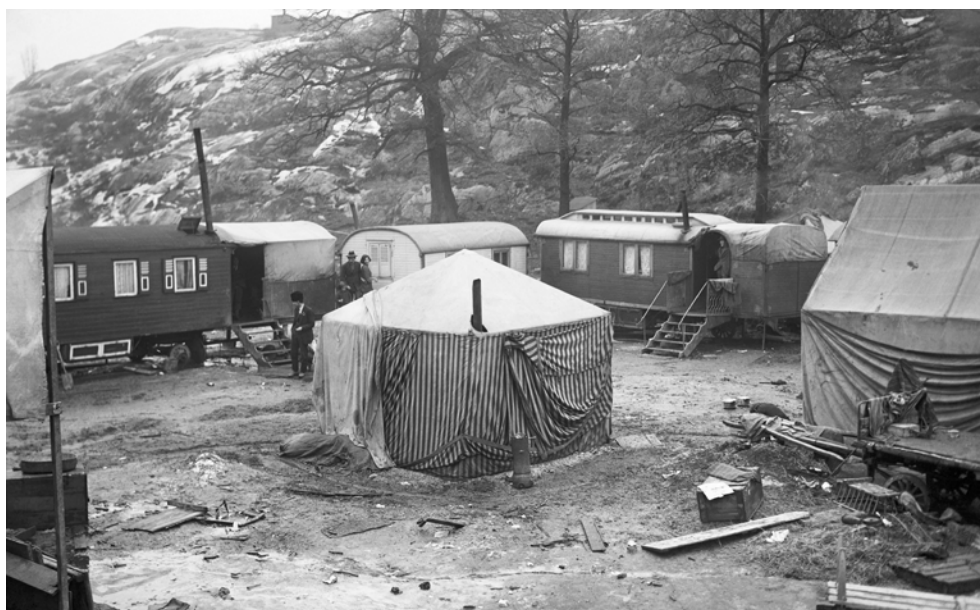
Foto från ett romskt läger i Gröndal, Stockholm, 1927.

I början av 1950-talet höjdes många röster i Sverige för att man måste förbättra romernas levnadsvillkor. Det gav resultatet att man 1954 bestämde att det skulle ordnas bostäder åt romer och 1959 att romska barn skulle få gå i skolan. Då fick romer även rösträtt i Sverige.